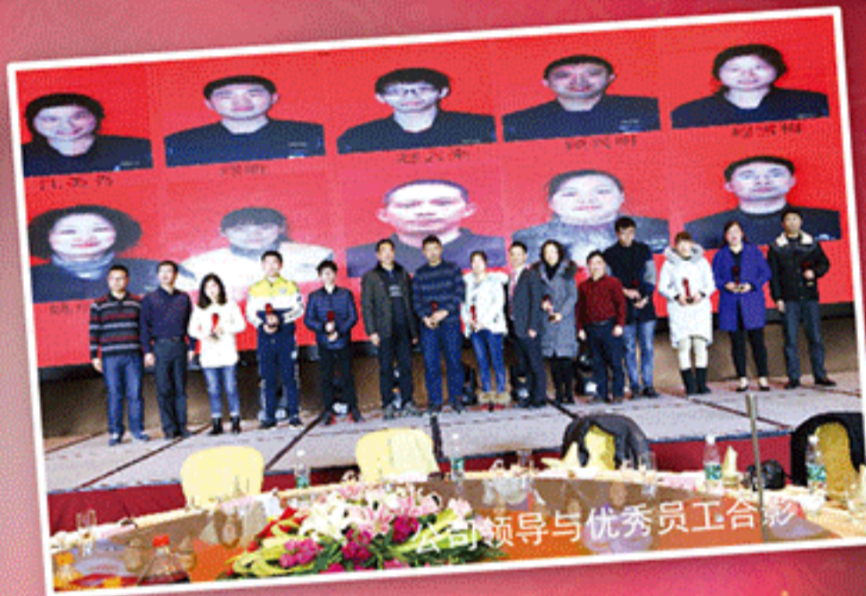
公司领导与优秀员工合影