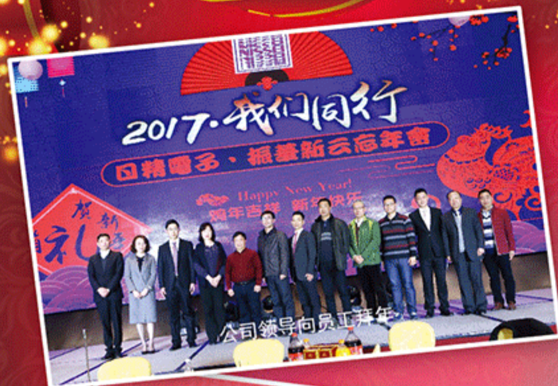
公司领导向员工拜年