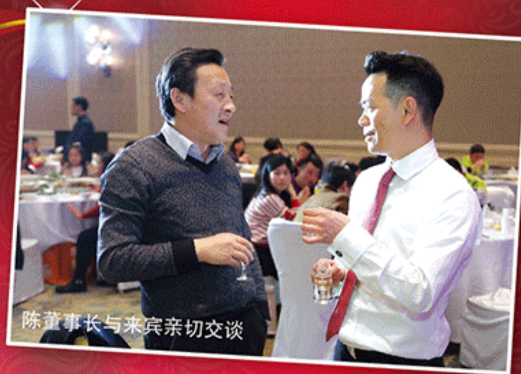
陈董事长与来宾亲切交谈