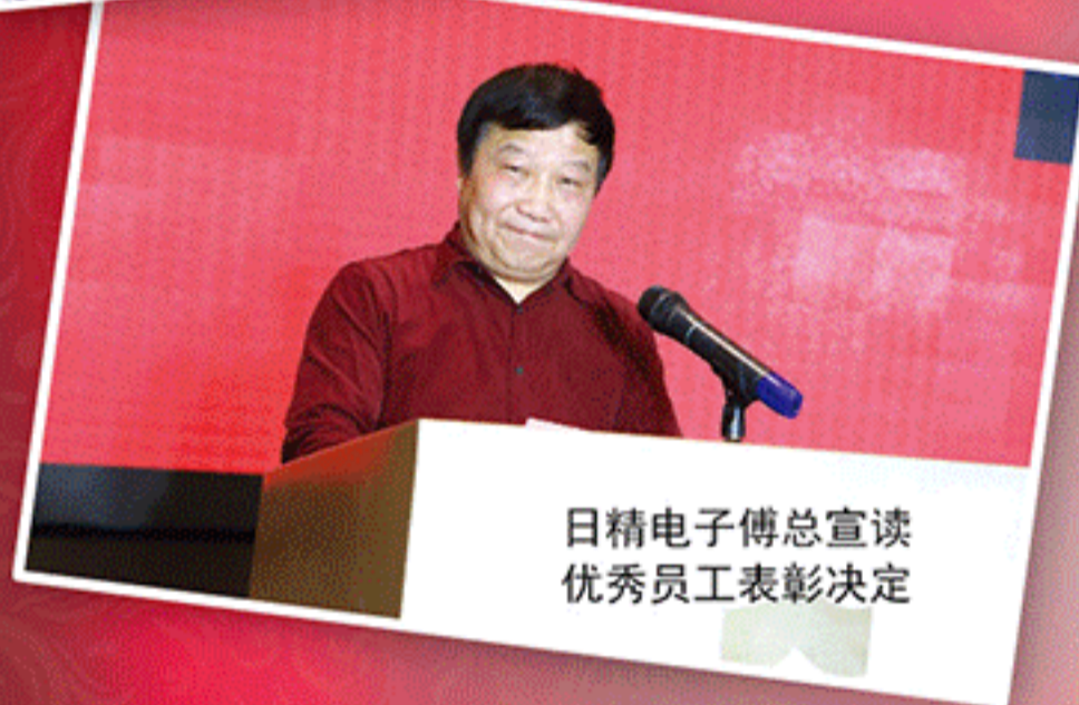
日精电子傅总宣读 优秀员工表彰决定