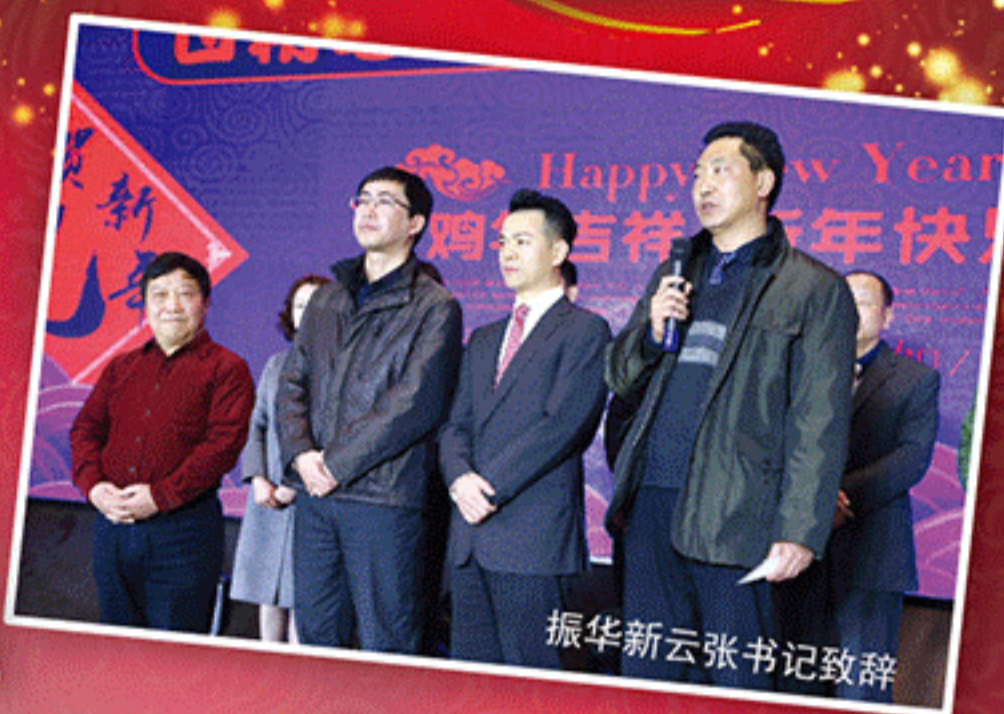
振华新云张书记致辞