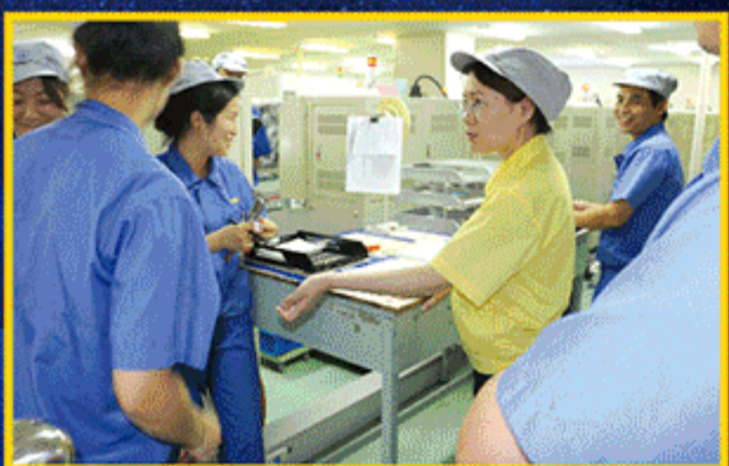
组委会领导与职工切磋